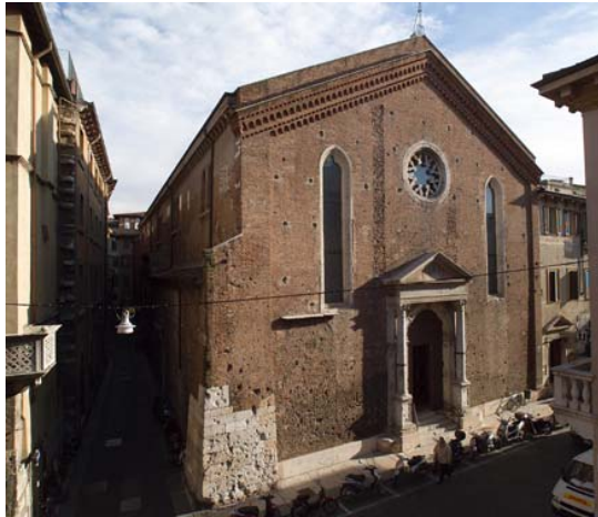
La facciata della chiesa