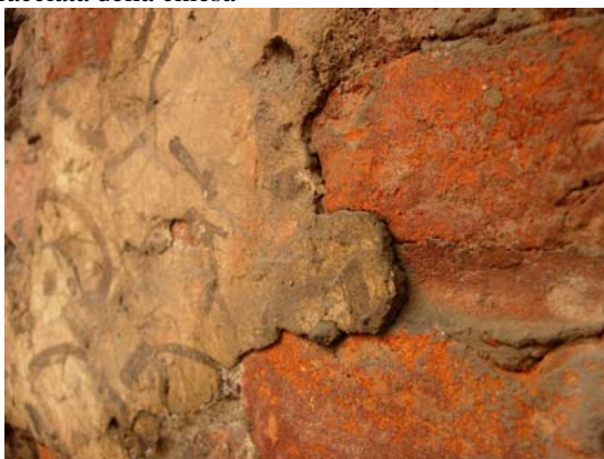
Lacerati dell'affresco cinquecentesco che copre i laterizi con tracce di scialbi