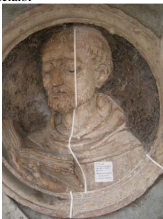
Prove di pulitura di un bassorilievo del portale cinquecentesco