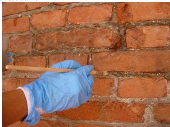
Consolidamento dei giunti di malta della cortina laterizia