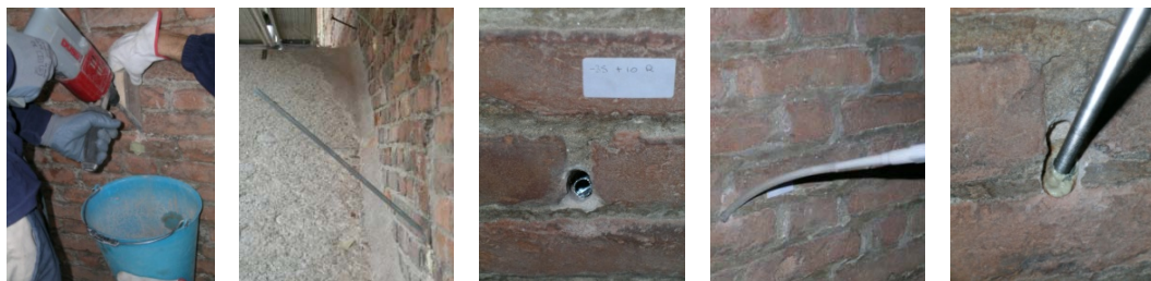
Le fasi dell'intervento strutturale:

Foro con inclinazione di 45° per circa 1 metro di profondità - Inserimento della calza metallica – Particolare della calza metallica inserita – Inserimento della resina – Inserimento della barra inox